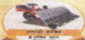
समाजी शक्ति 8 पंक्ति खान सोपन बंध

हमें हिमाचल प्रदेश के सभी ब्लॉकों, तालुका और जिलों में प्रेचाराजी की आवश्यकता हैकूपया 10 दिन के अंदर अपना करोबार विवरण भेजें dealership@vstillers.com / manish@vstillers.com या कॉल करें 9815881889 / 9560078182