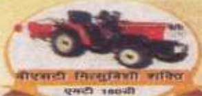
वीएसटी मिट्टाबिही शक्ति एमटी 180बी

वीएसटी शक्ति कृषि उपकरणों की एक विस्तृत श्रृंखला पेश करता है, जिसमें आपके खेत के सीमावर्त के लिए हल, जुताई, बुआई, पीछावेपण, खरपतवार छुटनी, फसल काटने के विविध उपकरण शामिल हैं। आज, खेती के लिए नए युग के तरीकों को अपनाएं। यह समय, वीएसटी शक्ति कृषि उपकरणों को अपनाने का है।